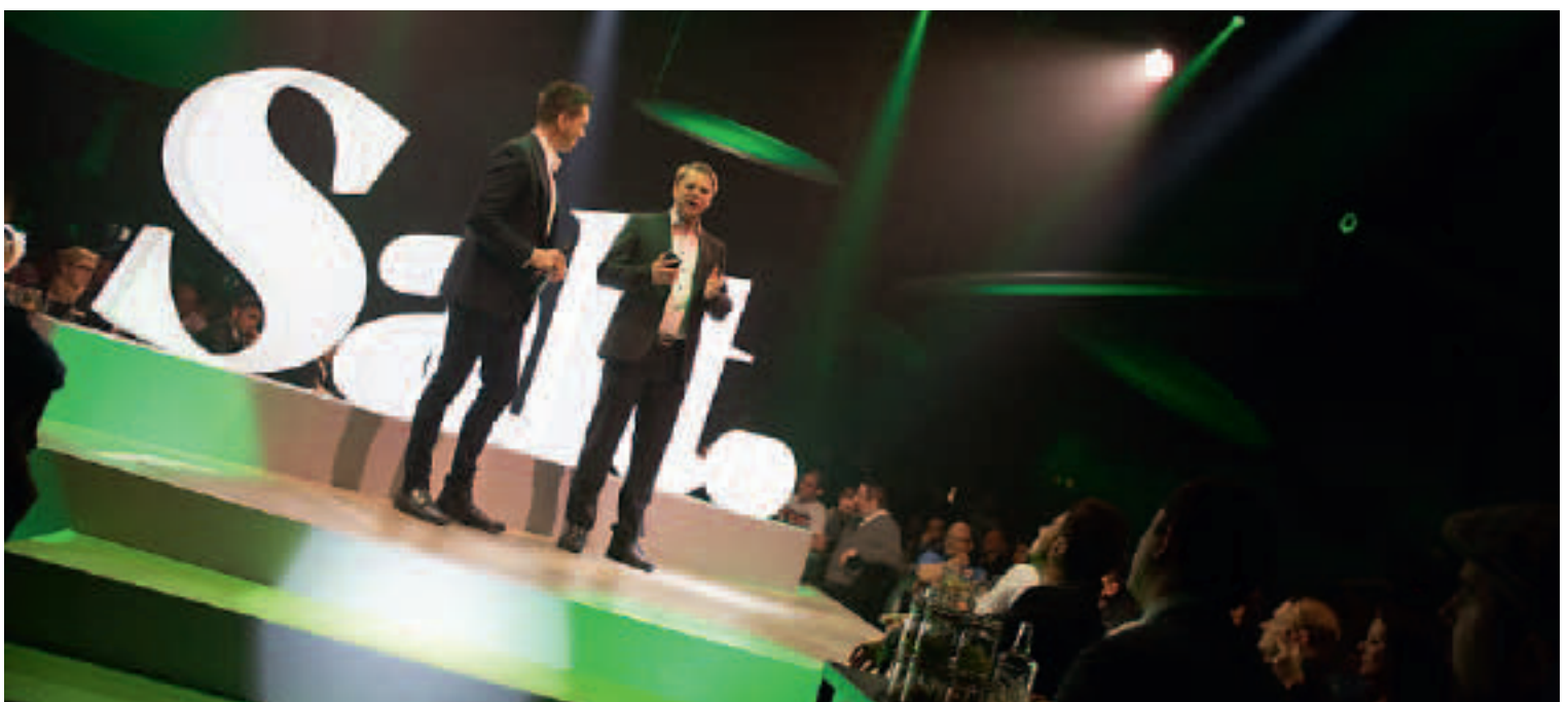
Launch-Event – Orange wird zu Salt. Habegger war als Generalunternehmer während elf Monaten im Einsatz.

Da sich unser Unternehmen immer sehr schnell entwickelt hat und andauernd neue Services dazugekommen sind, war und ist der Anspruch an unsere Mitarbeiterinnen und Mitarbeiter besonders hoch. So musste sich unsere Crew immer wieder an eine neue Organisationsform gewöhnen.