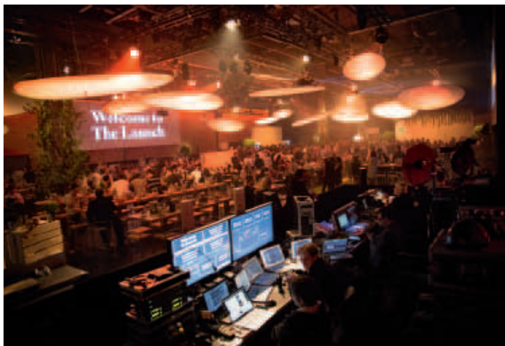
Habegger übernahm von der Projektentwicklung über die Enthüllungsinszenierung des neuen Brands bis hin zur Realisation des Events sämtliche Aufgaben in Zusammenarbeit mit Orange/Salt.