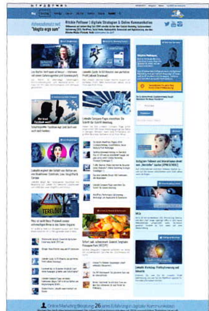
Grafische Gestaltung von Pettauers Blog-Website datenschmutz.net

schließen sich Unternehmen, die interne und externe Kommunikations-Prozesse effizient aufeinander abstimmen“, ist Pettauer überzeugt.